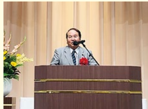
平木議員よりご祝辞