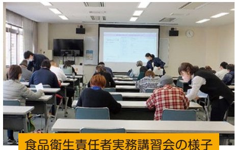
食品衛生責任者実務講習会の様子