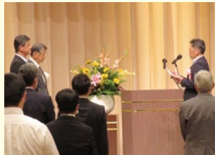
受賞者代表より謝辞