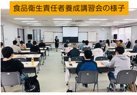
食品衛生責任者養成講習会の様子