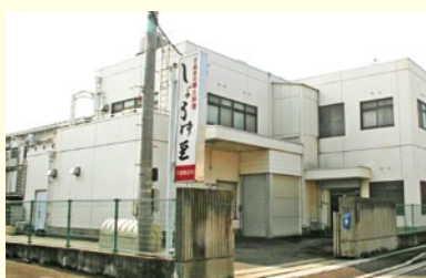
大西食品株式会社 (中讃)