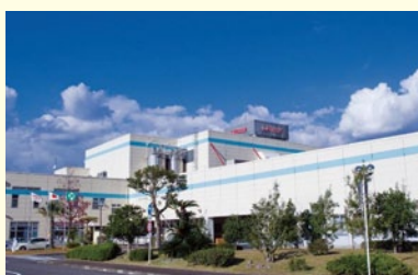
四国明治株式会社 香川工場 (西讃)

令和4年10月17日(月) 明治座にて表彰式が、18日(火) ニッショーホールにて食品衛生指導員全国大会が開催されました。厚生労働大臣表彰並びに(公社)日本食品衛生協会会長表彰等を受賞された皆様は次のとおりです。(敬称略)